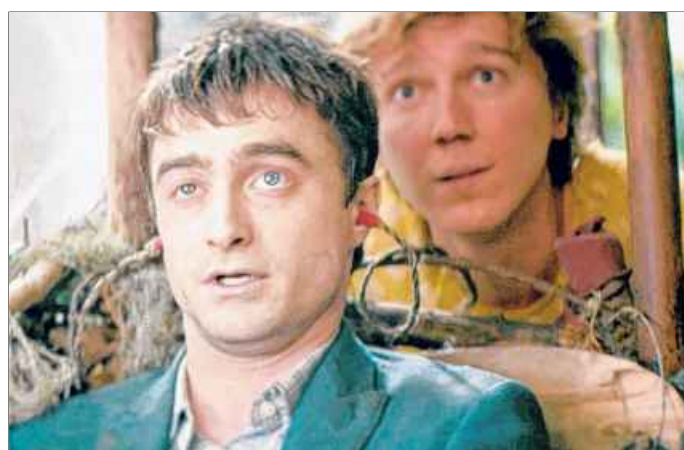
Daniel Radcliffe és Paul Dano a filmben. Zseniális kettejük játéka...

Hamar el lehet dönteni a filmről, kell-e nekünk vagy sem. Az első negyedórán megkapjuk az altesti poékok